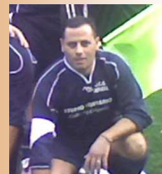
Pacifico: un veterano alla ribalta.